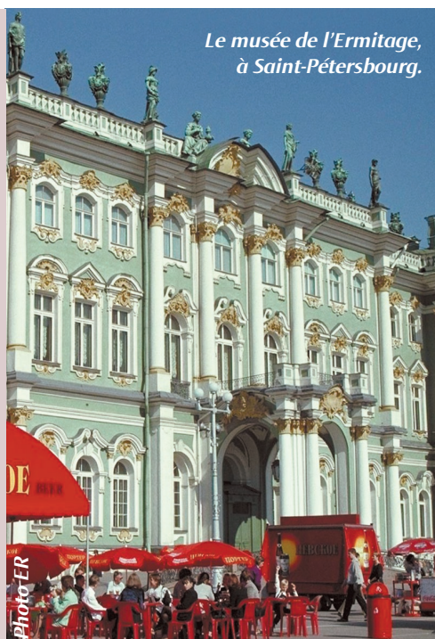
Le musée de l'Ermitage, à Saint-Pétersbourg.

Cet été, Nouvelles Frontières propose des prix exceptionnels avec des réductions pouvant atteindre 22 % sur certains de ces circuits sur les cinq continents. Parmi ceux-ci, le Circuit Découvrir « Saint-Pétersbourg des Arts et des Palais » avec départ le 30 juillet s'affiche à partir de 1.475 € au lieu de 1.627 € par personne pour 8 jours et 7 nuits en pension complète avec vols internationaux, transports intérieurs en bus et minibus, hébergement en hôtels 3 étoiles, guide local francophone et visites mentionnées au programme : tour de ville, musée de l'Ermitage, forteresse Pierre et Paul, excursions à Pouchkine, Pavlovsk, Petrodvorets, etc. www.nouvelles-frontieres.fr ; tél. 000.825.000.825 et dans les agences Nouvelles Frontières.