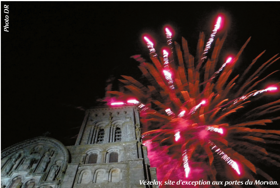
Vézelay, site d'exception aux portes du Morvan.