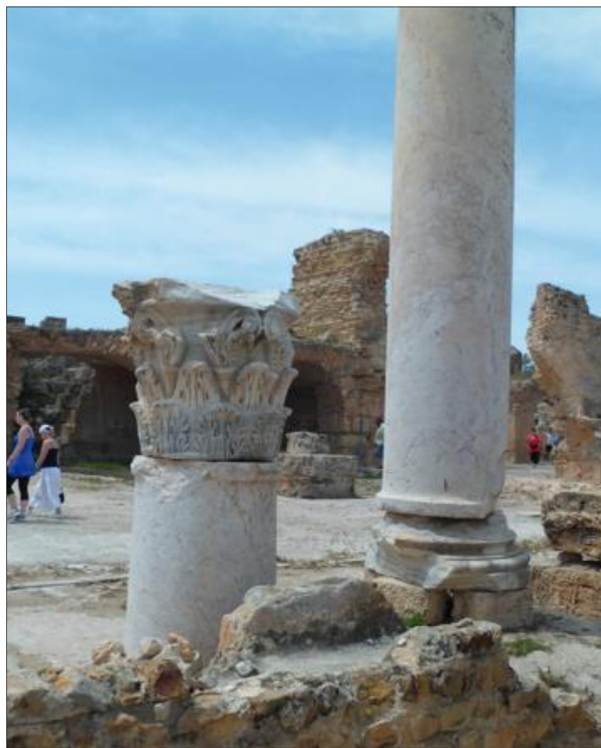
Carthage reflète 3 000 ans d'histoire, rythmés par les différentes conquêtes. Les traces sont encore visibles, comme les thermes d'Antonin, avec leurs colonnes érigées face à la mer.

Une fois entré dans ce labyrinthe, plongez dans l'univers des souks en empruntant les passages voûtés. Respirez les odeurs d'épices, de cuir et d'étoffes qui se dégagent des étals, tout en contemplant les vestiges gravés dans la pierre : les mosquées et les édifices serties de mosaïques aux influences andalouses, turques ou européennes. Une immersion dans le monde des Mille et Une Nuits.