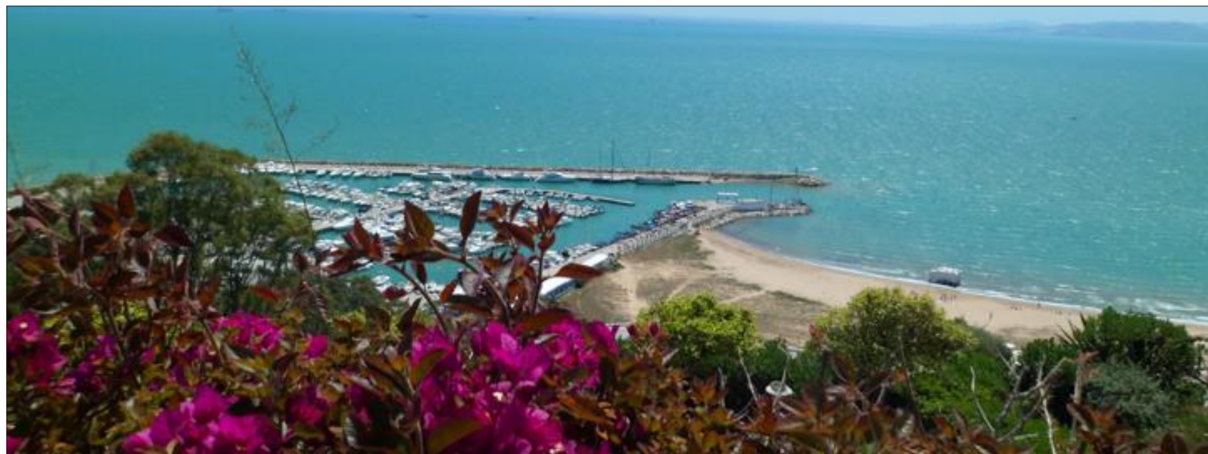
À Sidi Bou Saïd, le jardin menant au palais Erlanger offre une vue imprenable sur la marina.