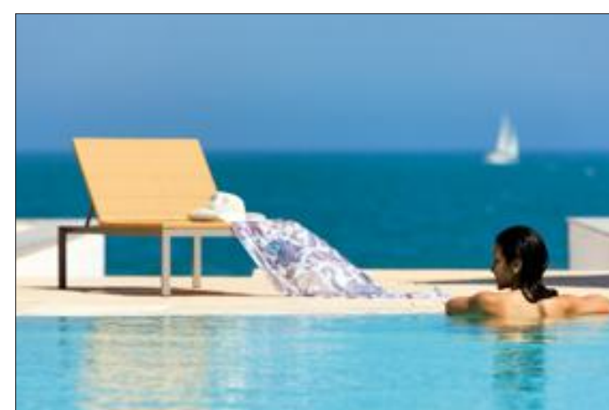
Dans ce cinq étoiles, détente est le maître mot.

Plongés dans une atmosphère enveloppante de sérénité, ils peuvent profiter d'une gamme de soins tunisiens, du hammam oriental aux cabines de gommage au sable du Sahara, et poursuivre ce moment de relâchement dans l'espace tisanerie où, allongés sur un lit, ils savourent l'instant présent, bercés par une douce musique et caressés par la chaleur de l'ambiance tamisée. Un moment de délasserment pour lequel il aura fallu patienter quatre ans, le temps que les travaux de transformation de l'établissement