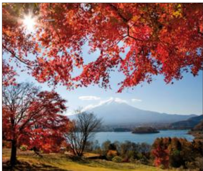
L'ascension du Mont Fuji est une expérience à la fois physique et mystique.

Et enfin, après une dizaine d'heures passées à marcher dans un paysage de lave désertique, le sommet vient à vous... Un vieux proverbe japonais dit que celui qui n'a jamais gravi le Fuji-San est un fou mais que celui qui l'a gravi deux fois est encore plus fou. Serez-vous celui-là ?